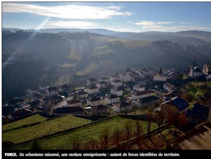
FORCE. Un urbanisme raisonné, une verdure omniprésente : autant de forces identifiées du territoire.

Et de débat, il n'y eut pas. « Le contenu me paraît extraordinaire-