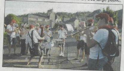
La Banda Polysons a mis l'ambiance le samedi soir.

des bénévoles du comité, cette nouvelle édition a poursuivi la tradition de belle manière. Durant ces deux jours, le restaurant Mallet a également organisé un week-end festif avec repas et bals qui ont drainé un très large public.