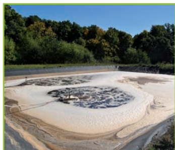
Aération des deux bassins de stockage des lixiviats.