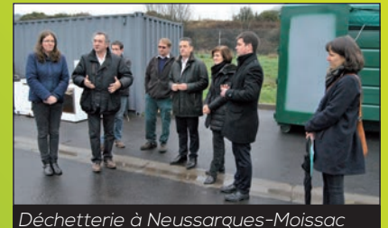
Déchetterie à Neussargues-Moissac

Le SYTEC a contractualisé avec l'éco-organisme ECO-MOBILIER qui va organiser le démantèlement et le recyclage des meubles usagés, pour le compte des communautés de communes membres. La première déchetterie équipée d'une benne à mobilier est celle de Neussargues-Moissac. Les autres déchetteries intercommunales seront équipées au rythme fixé par Eco-Mobilier.