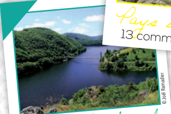
Pays Pierrefort-Neuvéglise 13 communes - 4 élus