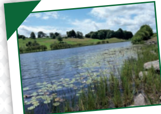
Gentiane 12 communes - 6 élus

Autrac, Auvers, Chastel, Cronce, Pinols, St-Etienne-sur-Blesle.