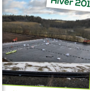
Limitation de la zone du casier en cours d'exploitation.

COÛT GLOBAL DES TRAVAUX : 1 416 000 € HT