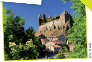
La Planèze 6 communes - 2 élus