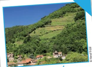
Pays de Massiac 15 communes - 4 élus