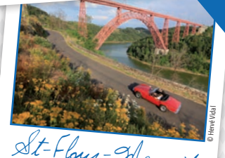
St-Flour-Margeride 29 communes - 13 élus