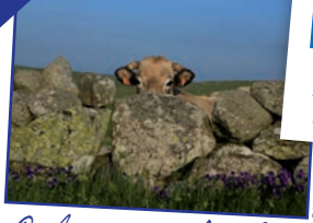
Caldaquès-Aubrac 11 communes - 2 élus