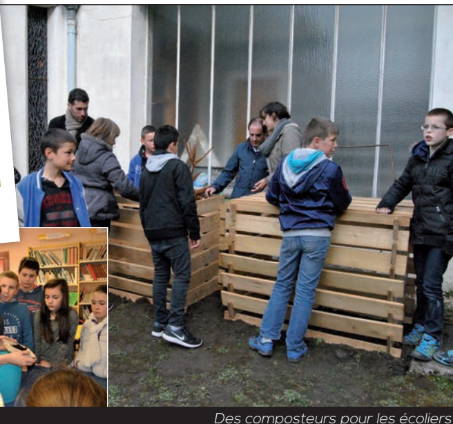
Des composteurs pour les écoliers