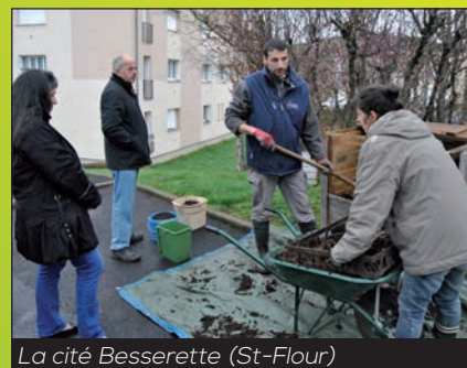
La cité Besserette (St-Flour)

Distribution du compost dans les nombreuses cités et résidences qui compostent depuis 2012.