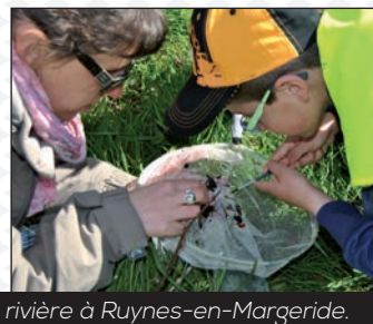
Sortie rivière à Ruynes-en-Margeride.