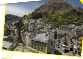
Pays de Murat 13 communes - 6 élus