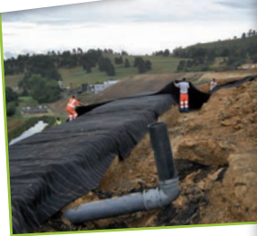
Amélioration de l'étanchéité de l'ancienne zone de stockage.