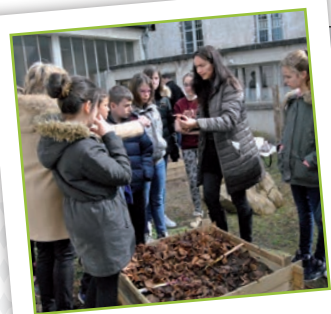
Un jardin au naturel

Le groupe scolaire Saint-Joseph (Saint-Flour) a installé des composteurs pour transformer en compost les déchets de préparation de la cantine : 400 repas par jour ! Le compost produit sera utilisé dans le jardin au naturel également installé par les collégiens de l'atelier "Protection de la nature et de la biodiversité".